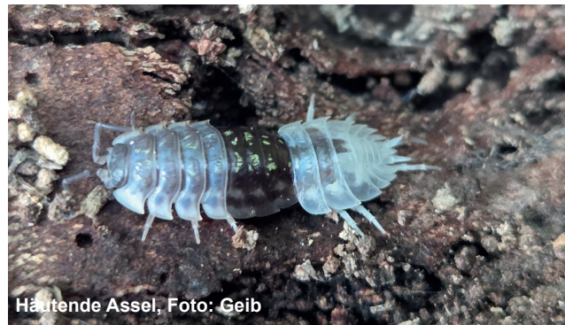
Häutende Assel